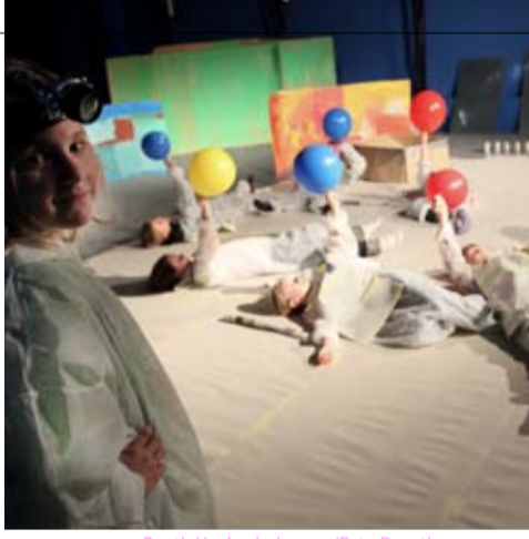
V. OBEN N. UNTEN Beuth Hochschule 2010 • Peter Härtling, Anklam 2009 • Anklam 2009